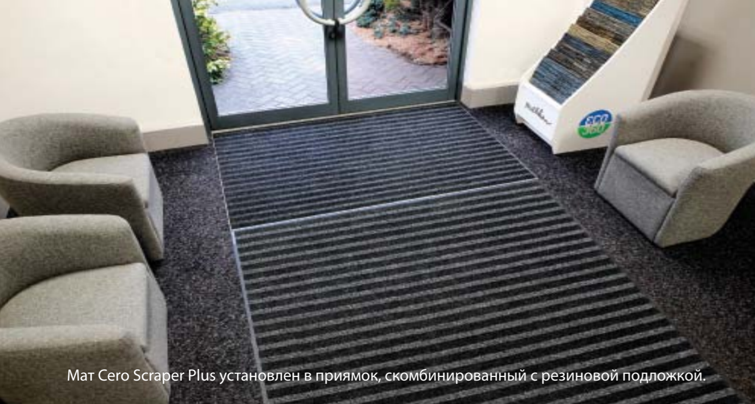
Мат Cero Scraper Plus установлен в приямок, скомбинированный с резиновой подложкой.