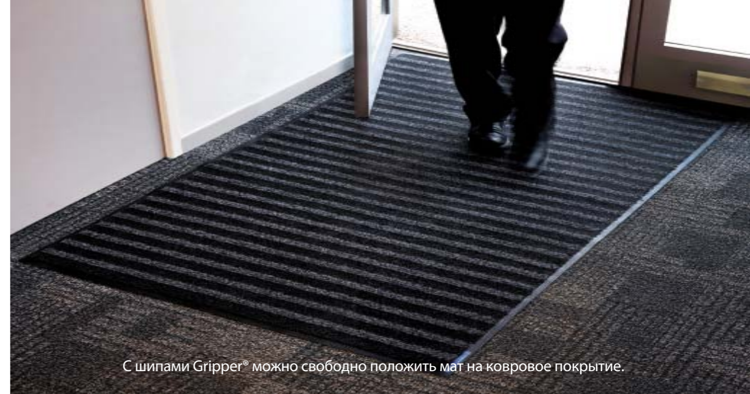
С шипами Gripper® можно свободно положить мат на ковровое покрытие.